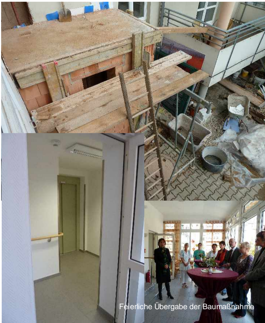
Feierliche Übergabe der Baumaßnahme

Im Laufe der letzten Jahre zeichnete sich immer mehr ab, dass sich durch die bauliche Situation des Wohnbereiches 3, der sich im so genannten Altbau befindet, zusätzliche Beschwerlichkeiten für Bewohner und Personal ergaben. Moderne Hilfs- und Transportmittel für die Pflege und den Service konnten nur begrenzt zum Einsatz kommen. Die Belegung des Wohnbereiches gestaltete sich zunehmend erschwerend, da neben den individuellen Bedürfnissen der Bewohner nun auch immer wieder die baulichen Gegebenheiten Berücksichtigung finden mussten.